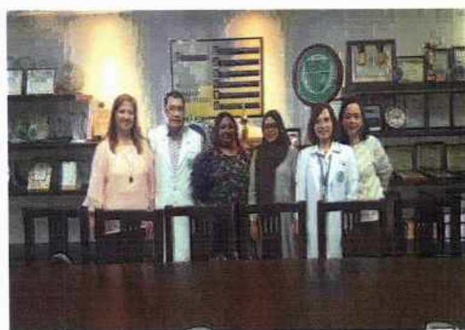
ފޮތްތައް ބަލައި ނެގުމަށް ފުރުޞަތު ލިބިފައިވާ ބައެއް ފަރާތްތަކުގެ ފަރާތުން ފޮތްތައް ބަލައި ނެގުމަށް ފުރުޞަތު ލިބިފައިވާ ކަމަށް ބުނެފައި ވެއެވެ.